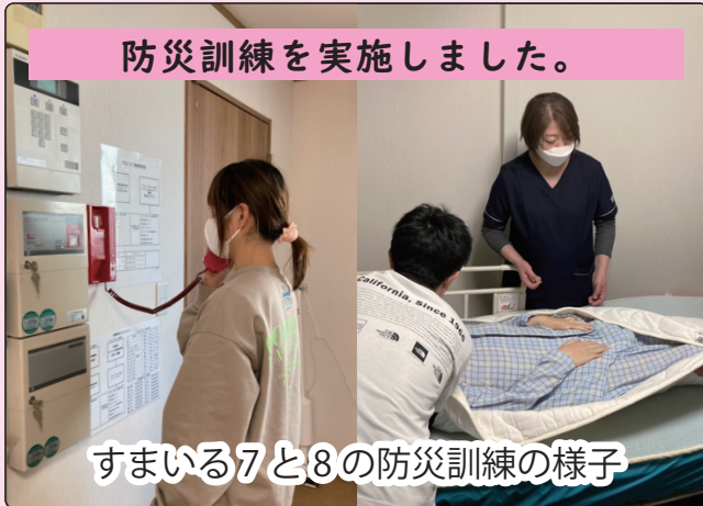
防災訓練を実施しました。